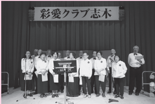
▲日頃の練習の成果を十分に発揮し会場内が和やかな雰囲気となりました♪

志木市老人クラブ連合会と社会福祉協議会の共催事業として「志木彩愛クラブまつり」を開催しました。総合福祉センター1階ホールで芸能発表を、2階福祉センターで作品展覧会を行い、2日間で1,000人以上の人が来場しました。