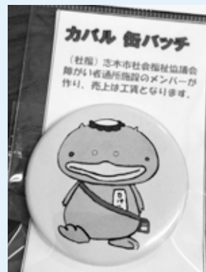
▲大人気のカバル缶バッチ