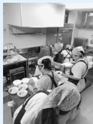
▲食堂ひまわり お弁当を提供するために 準備している様子