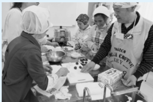
▲料理教室の様子 料理ボランティアが講師の教室です。