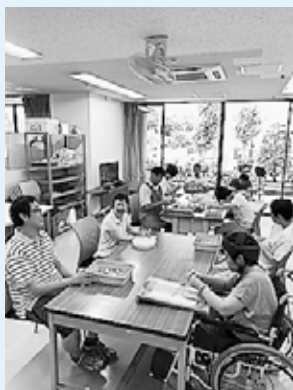
▲日中活動の様子 (アクリル製品作りなど)