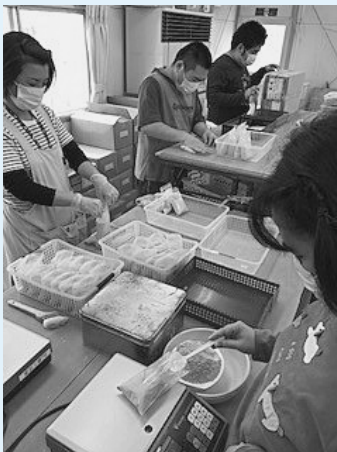
▲香炉灰の袋づめ作業