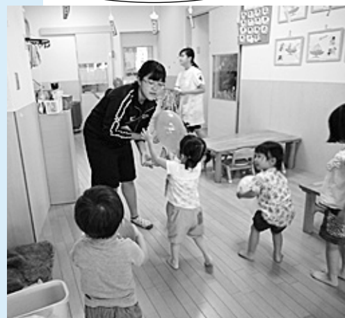
▲保育園でのボランティア体験 子どもたちも大喜び♪

ボランティア体験をきっかけにして、 「将来福祉の仕事をしてみたい」などの 目標を見つけた人もたくさんいます。 いろいろな人と出会って、学校の中だけでは できない体験をしてみてくださいね！