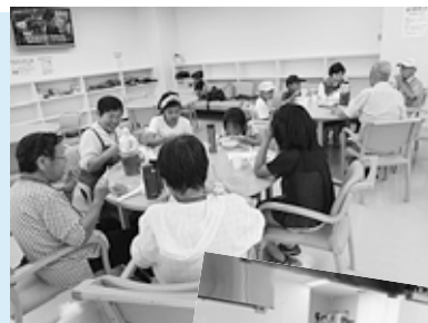
◀ランチルームの 様子