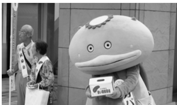
▲街頭募金で大人気！カパルくん

秋ヶ瀬スポーツセンター、鯉清、高齢者あんしん相談センターあきがせ、高齢者あんしん相談センターせせらぎ、志木宗岡郵便局、志木市総合福祉センター、志木市福祉センター、宗岡公民館