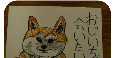
硬筆「きれいな文字を書こう」