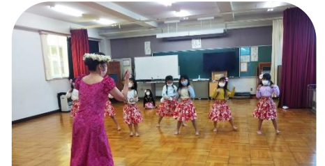
フラダンス 「パウスカートを着けて踊ろう」