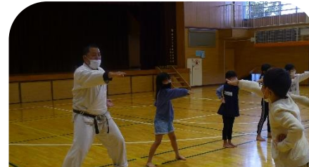
空手 「正しい姿勢で型を決めよう」

新型コロナウイルスの影響で、これまで休止していた体験プログラムがしばらくぶりに行われました。1・2年生のみなさんは「初めまして！」でしたね。志木っ子の体験プログラムでは、志木市で活動されている「市民先生」からさまざまな学びを得ることができます。参加した子どもたちは少し緊張した表情を見せながらも、とてもステキな時間を過ごしていました。今年度の体験プログラムは12月で終了となりますが、これからも市民先生と楽しい内容を考えていきたいと思ひます。