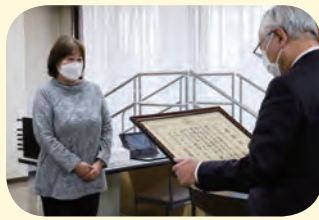
▲表彰式が中止となったため、 本会常務理事が伝達しました

志木音訳ボランティアもくせいの会は、昭和57年に設立し38年にわたり、目の不自由な人や高齢者のために、広報しき、しき社協だより、議会だよりなどの広報紙を音訳するボランティア活動を続けています。さらに、声の雑誌「ひまわり」や市内図書館への録音資料の寄贈、個人からの依頼にも対応するなど、幅広く活動しています。