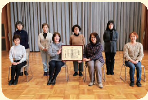
※撮影時のみマスクをはずしています