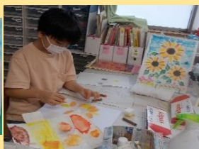
先生が優しく丁寧に教えてくれました！