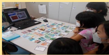
4施設とオンラインでつながり、志木市の歴史や文化財について学びました。