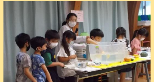
「この野菜は浮くのかな？」見て試して学びました。