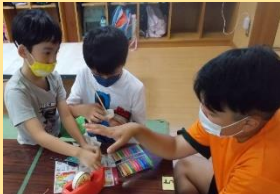
「紙コップ竹トンボ」をクルクル飛ばして遊びました。