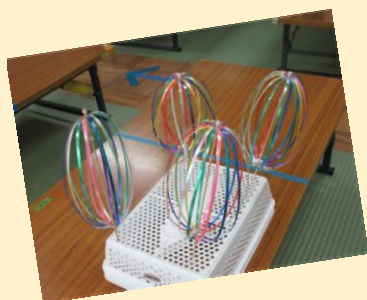
くるくるレインボー