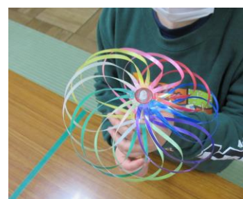
くるくるレインボー