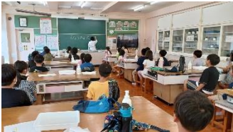
体験プログラム 科学実験教室