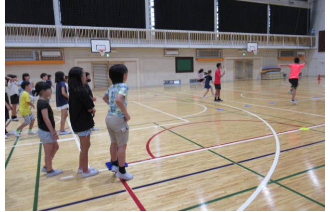
体験プログラム『走り方教室』