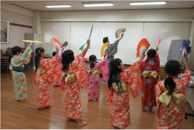
体験プログラム『舞踊』