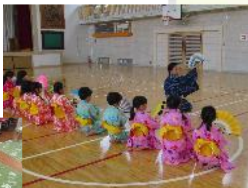
体験プログラム『舞踊』