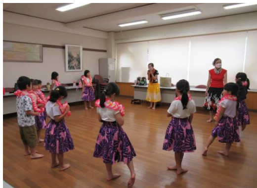
体験プログラム『フラダンス』