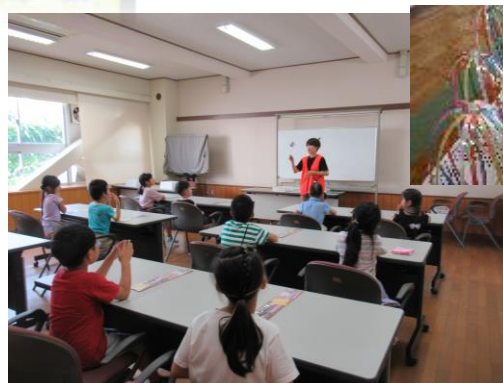
ワークショップ『くるくるレインボー』