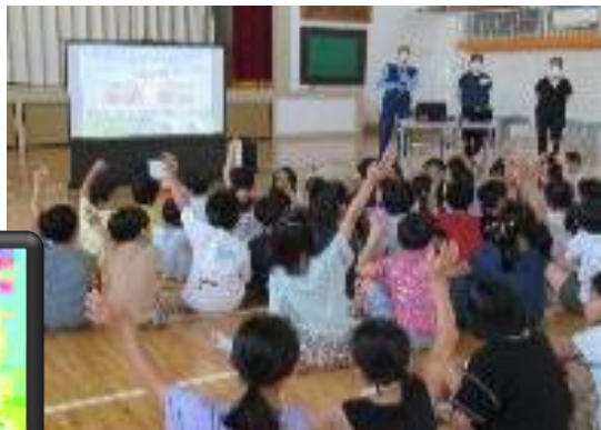
防犯教室：埼玉県警「あおぞら」