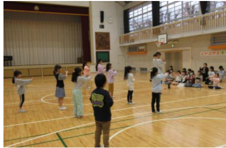
体験プログラム『ダンス』