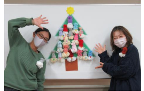
体験プログラム『ハンドメイド』 ～毛糸で作るサンタの顔～