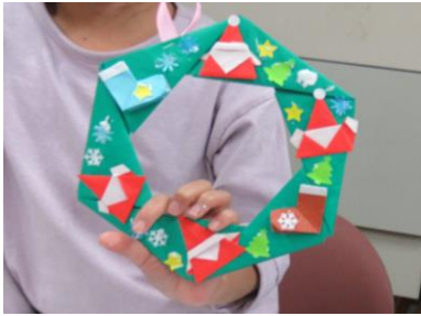
体験プログラム『折り紙』 ～クリスマスリース～