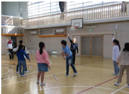
体験プログラム『バドミントン』