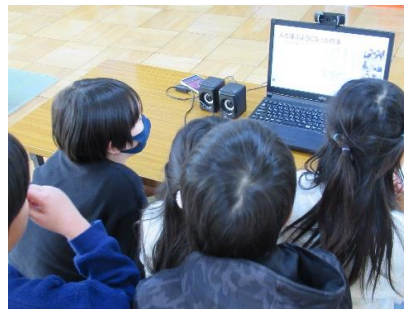
体験プログラム 「オンライン交流会」～志木市について学ぶ～