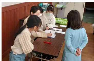
体験プログラム「硬筆」 素敵な年賀状が完成しました！