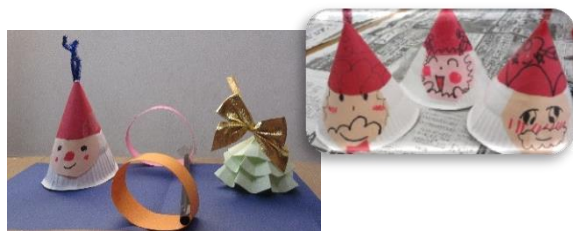
「宗岡りんくすとあそぼう」 紙皿と画用紙を使って、「サンタクロース」と 「クリスマスツリー」を制作しました♪