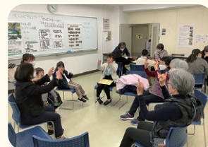
▲脳活性化ゲーム体験の様子