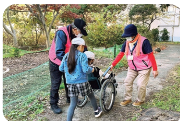
▲市内小学校で行った車イス体験