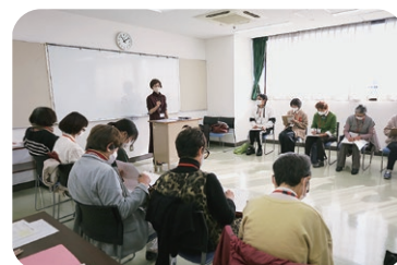
▲傾聴ボランティア養成講座