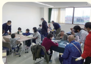
▲ボードゲーム体験の様子

3月2日(土) 総合福祉センターまつりの中で、地域活動の活性化を目的とした体験会が開催され、483人が参加しました。「大人も子どもも楽しめた」「またやってみたい!」といった声があり、障がいの有無・年齢・国籍を問わず交流を楽しんでいる様子が見られました。