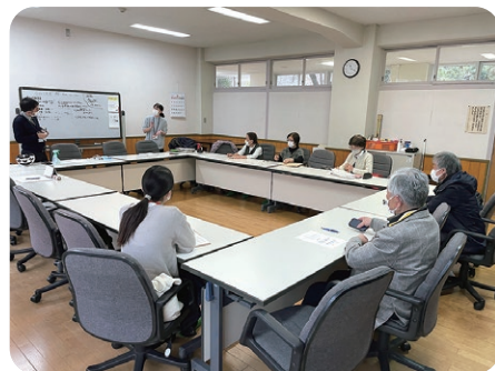
▼館・幸町協議体話し合いの様子

地域のことは地域の方に聞くのが一番です。皆様の力とお知恵を借りながら、安心して暮らせるまちづくりを目指します。今後も皆様のご意見をお聞かせください。