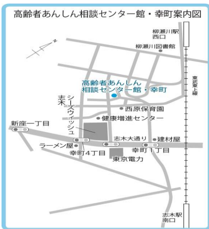
志木市高齢者あんしん相談センター館・幸町