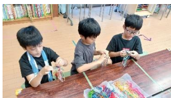
夏休みの工作 (ミサンガ作り)の様子