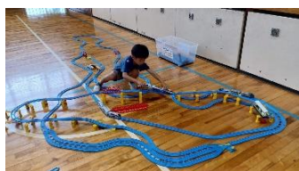
7/20 移動児童センター