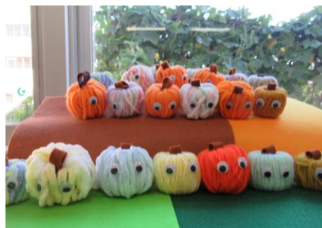
体験プログラム『ハンドメイド』 ～毛糸のかぼちゃ～