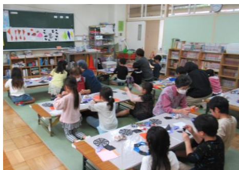
体験プログラム『折り紙教室』 ～ハロウィン～