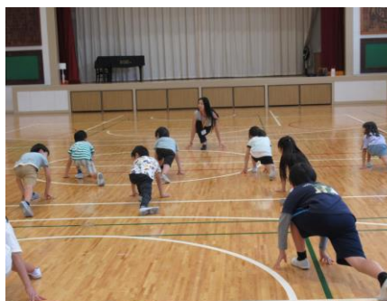
体験プログラム『モデルウォーキング』