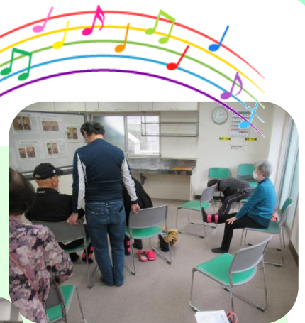
百歳体操体験コーナー