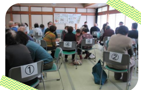
第二部：グループワーク