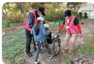
▲福祉教育「車いす体験」の様子