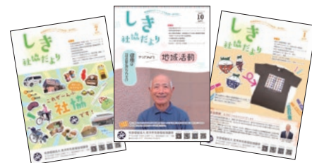
▲しき社協だよりの発行