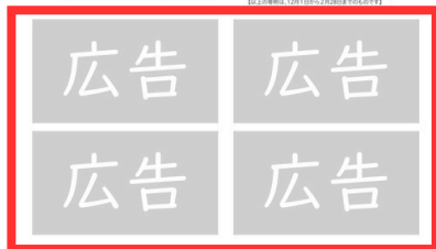
※裏表紙イメージ図